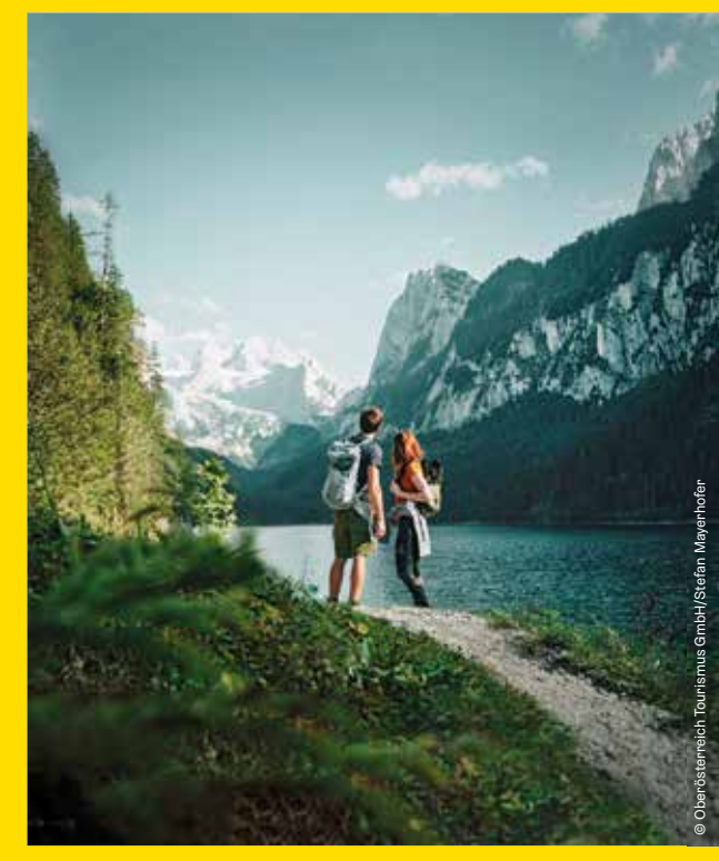
ATTERSEE-ATTERGAU - AUSSERLAND SALZKAMMERGUT RACHICE - DACHSTEIN SALZKAMMERGUT - FUSCHLSEEREGION AMNOSEE-IRSEE - TRAUNSEE-ALMTAL - WOLFGANGSEE